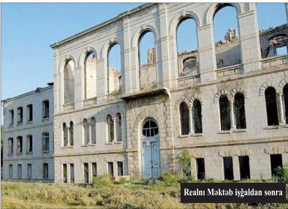
Realni Məktəbi işğaldan sonra