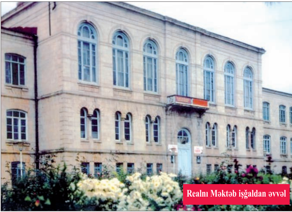
Realni Məktəbi işğaldan əvvəl

Prezident İlham Əliyevin 2022-ci ilin Azərbaycan Respublikasında “Şuşa İli” elan edilməsi haqqında Sərəncamından