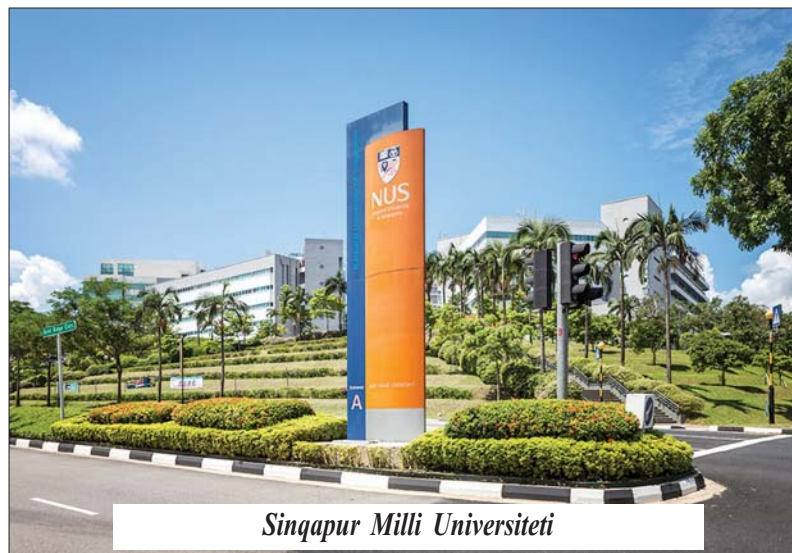
Sinqapur Milli Universiteti