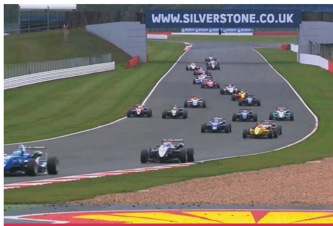
Formula 1 motor racing at Silverstone