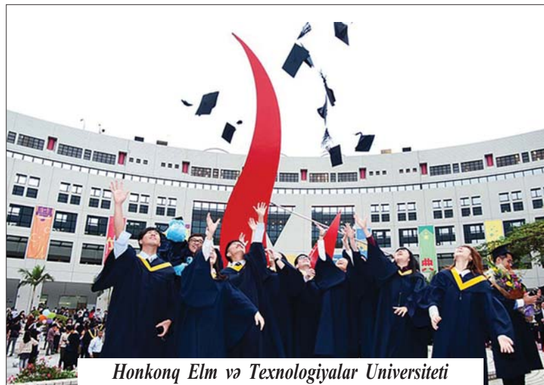
Honkonq Elm və Texnologiyalar Universiteti