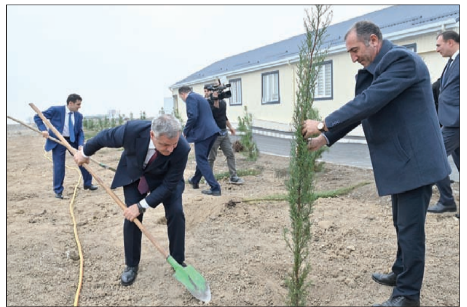
Vətən müharibəsində döyüşən təhsil işçiləri ilə görüş

Noyabrın 3-də Tərtər rayonuna mediatur çərçivəsində rayon üzrə 44 günlük Vətən müharibəsində döyüşən təhsil işçiləri ilə görüş keçirilib.