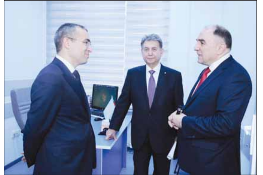
AMEA və Təhsil Nazirliyi arasında əməkdaşlıq perspektivləri müzakirə edilir.