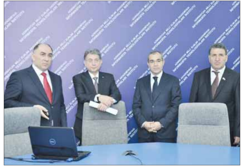
Qonaqlar institutun Distant Tədris Mərkəzi ilə tanış olurlar.