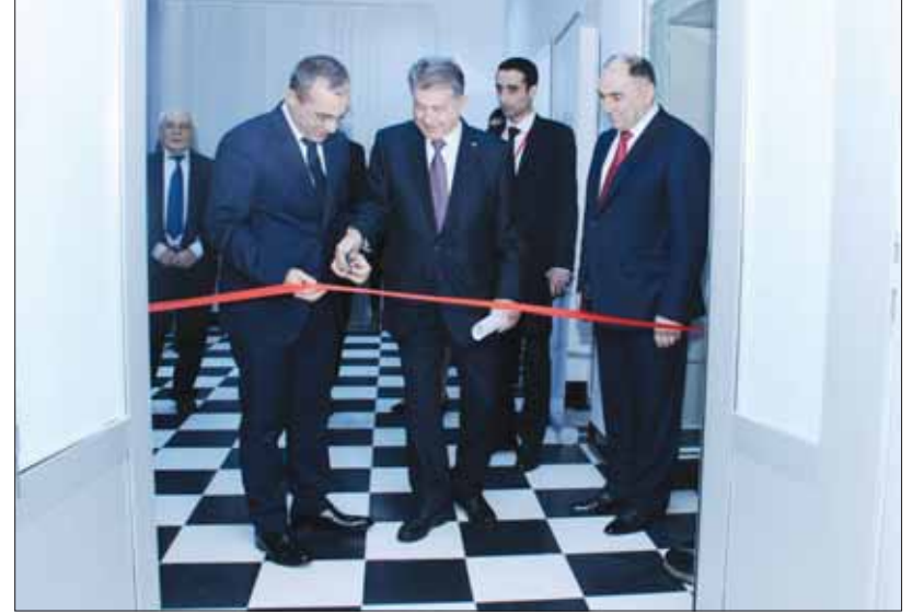
İnstitutun Elektron Kitabxana Mərkəzinin açılışı.