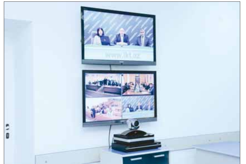
Distant Tədris Mərkəzində eyni vaxtda Naxçıvan və Gəncənin doktorant və dissertantlarına informatika kursu tədris edilir.