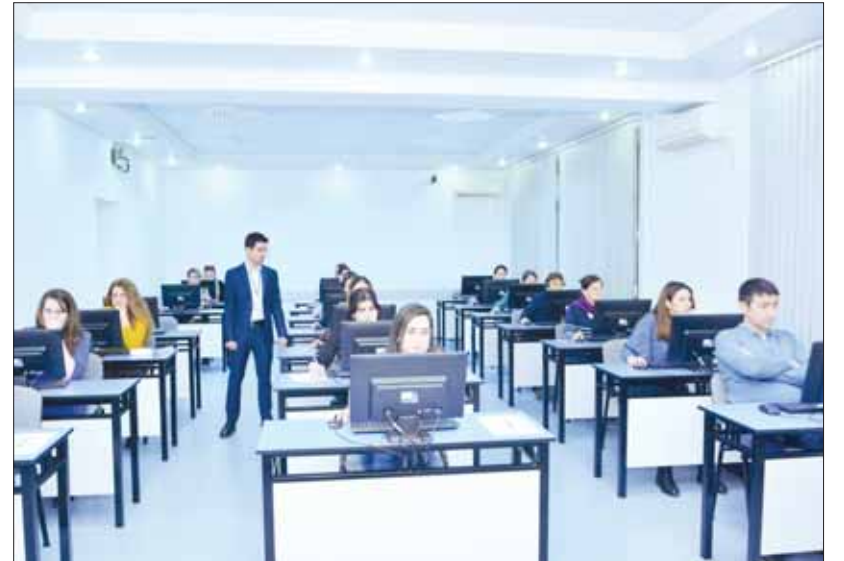
Tədris-İnnovasiya Mərkəzində imtahan prosesi.