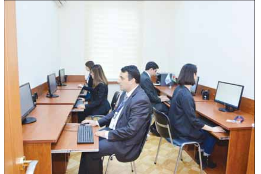
AzScienceNet-in yeni xidmət mərkəzi.