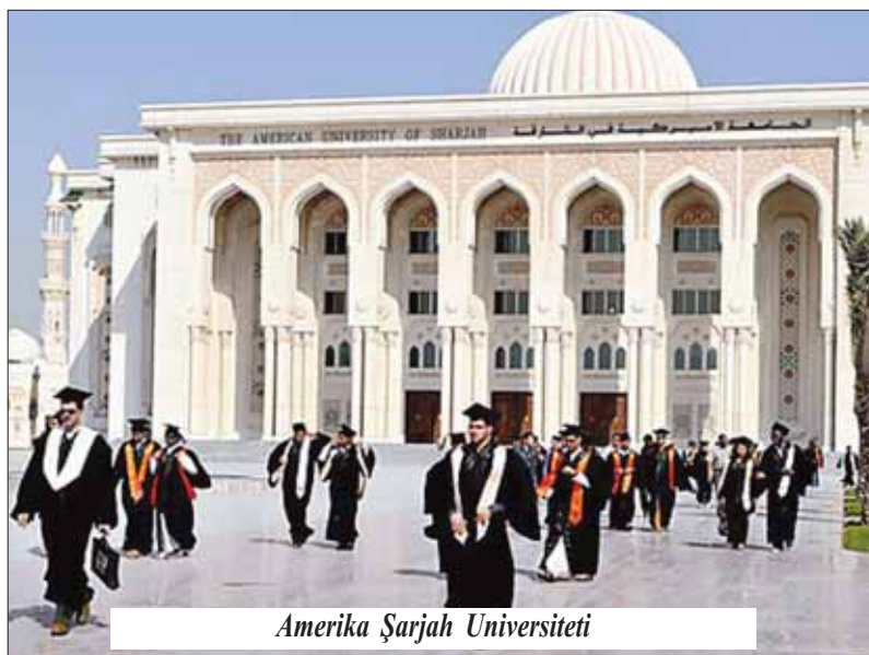
Amerika Şarjah Universiteti