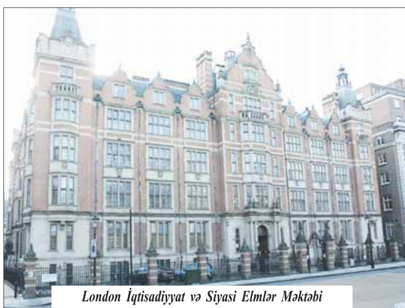
London İqtisadiyyat və Siyasət Elmlər Məktəbi