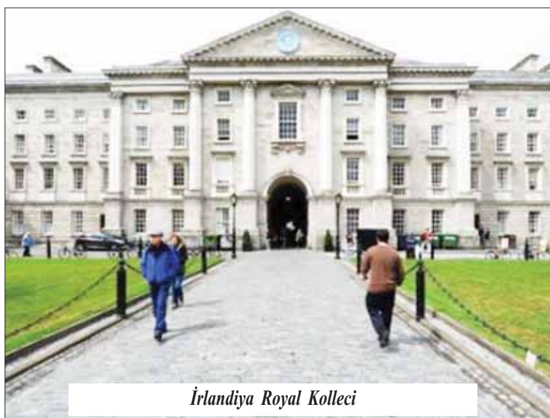
İrlandiya Royal Kolleci