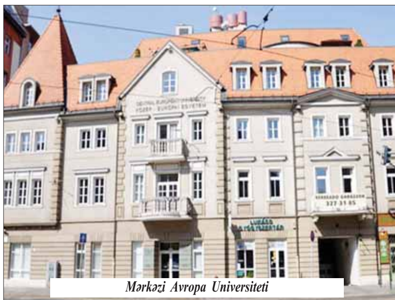
Mərkəzi Avropa Universiteti