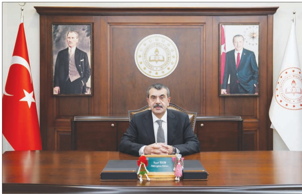
Türkiyənin milli təhsil naziri Yusuf Tekin "Azərbaycan müəllimi" qəzetinə müsahibə verib. O, müsahibədə Türkiyə və Azərbaycan arasında təhsil sahəsində əməkdaşlığın inkişaf istiqamətlərindən danışır. Həmin müsahibəni təqdim edirik.

"Türkiyə-Azərbaycan peşə təhsili sahəsində əməkdaşlıq protokolu"na dair Əlavə Protokol'u budəfəki sənədimizdə imzaladıq. Bu çərçivədə Azərbaycanda mövcud iki məktəbin peşə təhsil müəssisəsi kimi təşkil olunması və türk tərəfinin dəstəyi ilə yeni müəssisələrin açılması barədə razılığa gəldik.