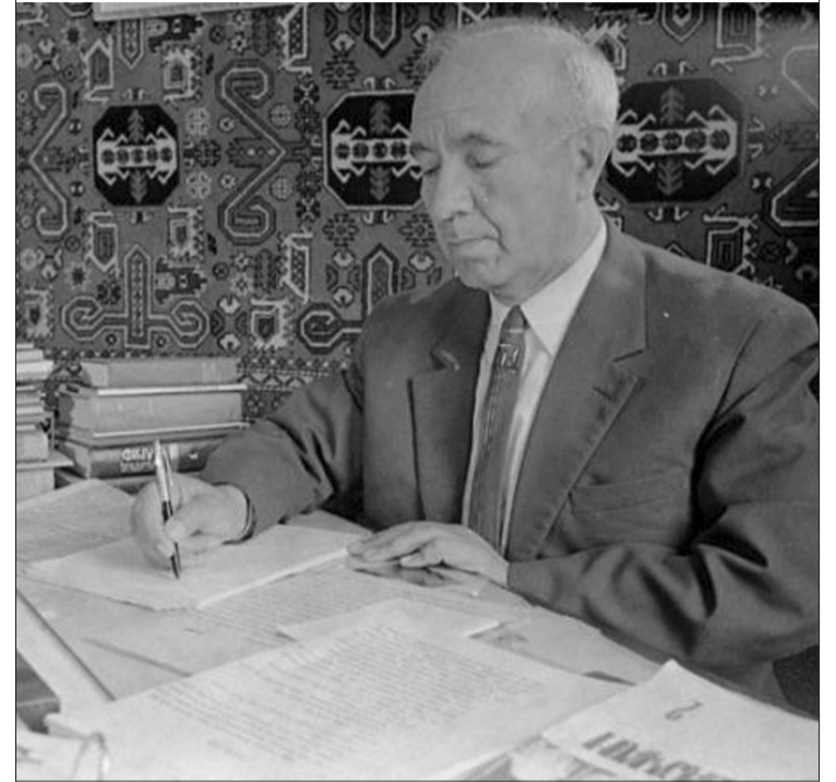
zə hərtərəfli kömək etmək üçün bundan sonra da bir sıra faydalı tədbirlər görmək lazım gələcəkdir. Xalq maarifinin, pedaqojisinin tarixi, klassik müəllimlər haqqında monoqrafiyalar yaradılmalıdır. Akademiyamızın ictimai elmlər bölməsində heç olmasa xüsusi şöbə yaradılmalıdır. Bakıda mühəndis evi, həkim evi, yazıçı evi olduğu kimi, müəllim evi də yaradılmalıdır. Belə bir mədəniyyət ocağına ehtiyac çoxdur. "Azərbaycan müəllimi" qəzeti, 24 noyabr 1960-cı il,

Cavanlıqda mən kənd müəllimi olmuşam. Düzdür, indi mənim adıma ədib, professor, alim deyirlər, amma mən müəllim adı ilə həmişə fəxr etmişəm və indi də edirəm. Mədəni cəmiyyətin, mədəni ailənin, mədəni vətəndaşın çox minnətdar olduğu zümrə müəllimlərdir. Gənc nəslin ilk nümunə, ibrət götürdüyü, sözünü, işini, hərəkətini təqlid etdiyi şəxs xalq müəllimidir".