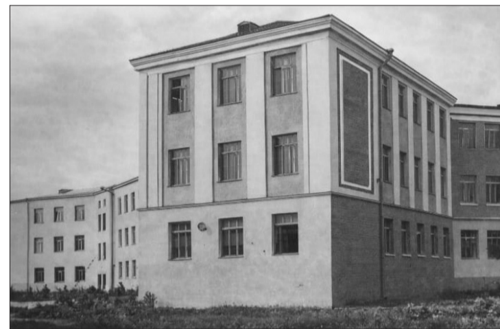
M.F.Axundov adına İrəvan azərbaycanlı tam orta məktəbin binası. 1938-ci il

Birincisi, 1948-1953-cü illərdə Qərbi Azərbaycanın elliklə köçürülən Göykəmbət, Çobankərə, Hacı Elyas (Hacıllaz), Məşanlı, Kolanlı, Üşəng, Hamamlı, Nəzirvan, Şorkənd, Məngüç, Əliqırıx, Qaraxal, Qaraqol, Körkükdə, Arbat, Böyük Kolanlı, Qarğabazar, Baxçalar, Korimbəyli, İydağı, Novruzlu, Dargalı, İmansalı, Torpaqçala, Axund Buzovand, Parpi, İpöklü, Dəlləkli, Xatınar, Ağsalax, Qəbəxli, Nursun, Qoxt, Molla Dursun, Aşağı Buzovand, Yuxarı Buzovand, Burastan, Çadqıran, Əkərək, Təkiyə, Ərnik, Kırışlı, Kotur, Daykənd, Güllüstan, Məsimli, Qulucan, Şurakənd, Şöllü, Xarratlı, Noraşen, Zəfərli, Hortun, Bıralı, Qaşqa, Şahablı, Həsənli, Carbax, Mollalı, Gölcüq, Qədirli, Cəbəçili, Güllüdzir, Sərinşəng, Təzəkənd, Qaradağlı, Yenica, Kələrə (Kələley), Müğnü, Haxış, Üşü, Vələcyar, Zirək, Artz, Quyulu, Qorçulu, Cul, Qaraqoyunlu, Həsənli, Xaraba Kolanlı, Əştərək, Yuva, Qədirli, Əzizkənd, Gölay-sor, Gədikvəng, Ayısəsi, Qarxun, Ağcaqışlaq, Kələlə, Şura, Avşar, Goravan, Taytan, Alməmməd, Şıxlar, Özcaqlı, Çanaxçı, Dərə (Üçmüdə-zində), Dargalı, Böyük Şöllü, Aşağı Ağbaş, Dvin, Böyük Gilanlar, Ağ Həməzli (Axamzalı), Daşlı, Qarğabazar, Yuxarı Kolanlı, Qaraqala, Hors, Oğrubəyli, Təpəbaş kəndi, Əlidərə (Qəmərlı), Arpavar, Çabaxlı, Qurdalı, Ağcarx, Qurdalı, Quruqdan, Şuğaylı, Haxic, Xırda Gilanlar, Sünbül, Cidəmlı, Toxaşalı, Dəllər, Gökəki, Burastan, Zöhrablı, Doqquz, Qaraxaç, Daşlı, Aşağı Novruzlu və digər kəndlərin