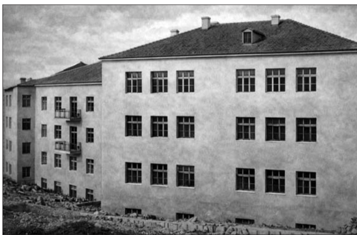
İrəvan Dövlət Pedaqoji İnstitutunun binası. 1936-cı il