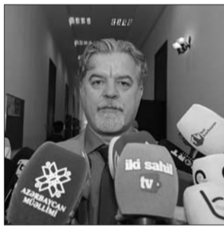
"TAU-da 174 tələbə təhsil alır"

Elm və sənayenin vəhdəti olan Türkiyə-Azərbaycan Universitetinin ixtisaslaşma və proqramları barədə məlumat verən çıxışçı qeyd edib ki, onların hər biri Türkiyə universitetlərinin zəngin akademik təcrübəsi əsasında həyata keçirilir. Dərslər ən müasir laboratoriyalarda keçilir.