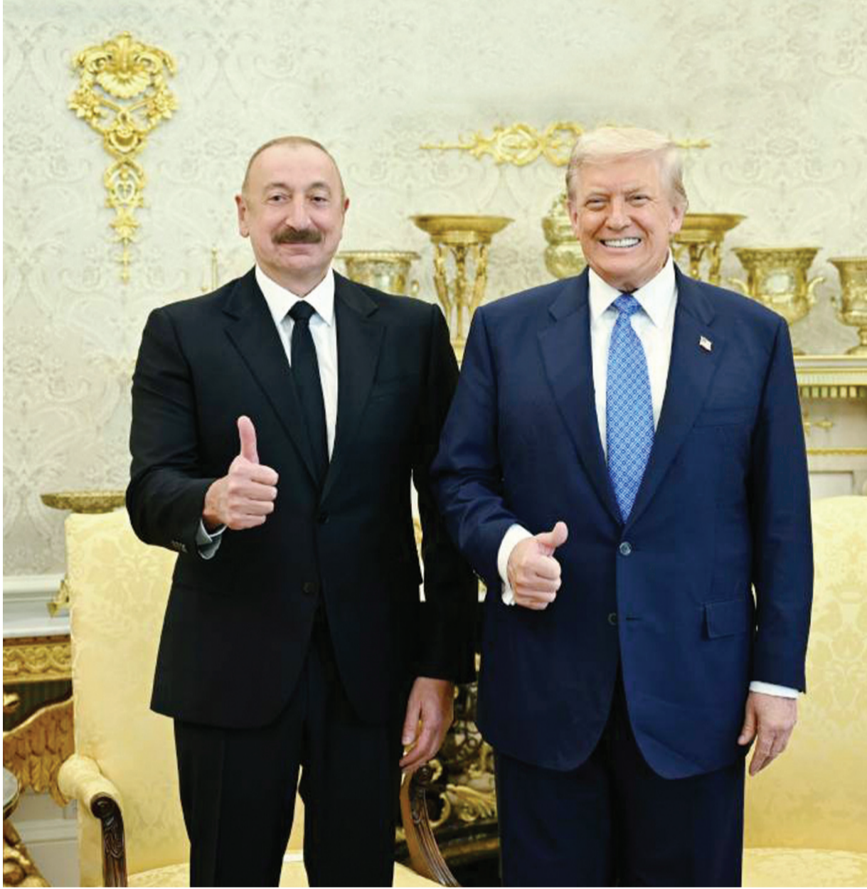
ABŞ Prezidenti Donald Tramp

Prezident İlham Əliyevin "Bakı Enerji Həftəsi"nin rəsmi açılış mərasimindəki çıxışından (1 iyun 2026-cı il)